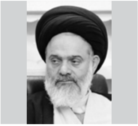
آیت‌الله حسینی بوشهری:

این شخصیت اخلاقی، سهم زیادی در ایجاد ارتباط با دانشجویان پیدا کرد و ایشان را به عنوان یک مشاور امین و استاد معلم اخلاق برای خود پذیرفته بودند.