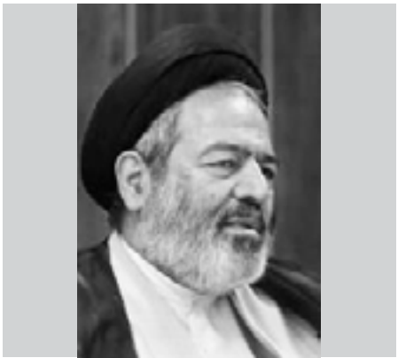
حجج الاسلام والمسلمین نواب:

این شخصیت اخلاقی، سهم زیادی در ایجاد ارتباط با دانشجویان پیدا کرد و ایشان را به عنوان یک مشاور امین و استاد معلم اخلاق برای خود پذیرفته بودند.